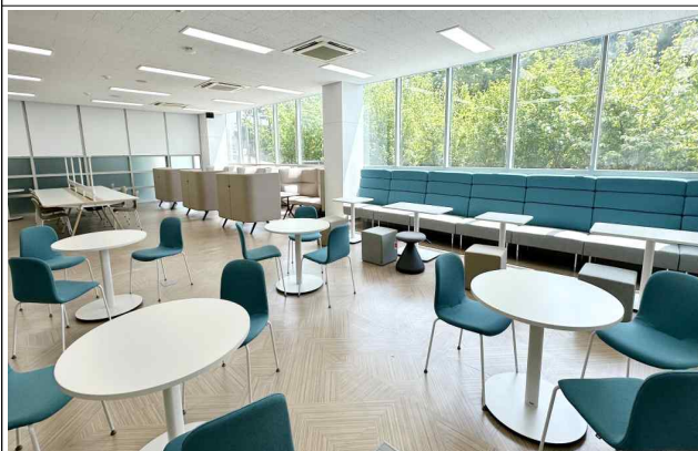
인하드림센터 1관 1층 창업드림라운지