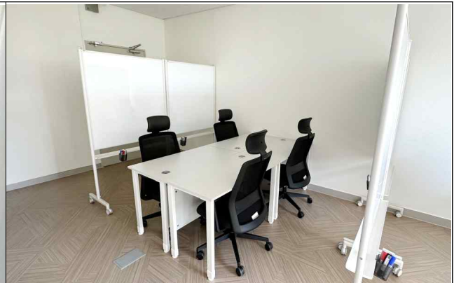
인하드림센터 1관 2층 공용보육실