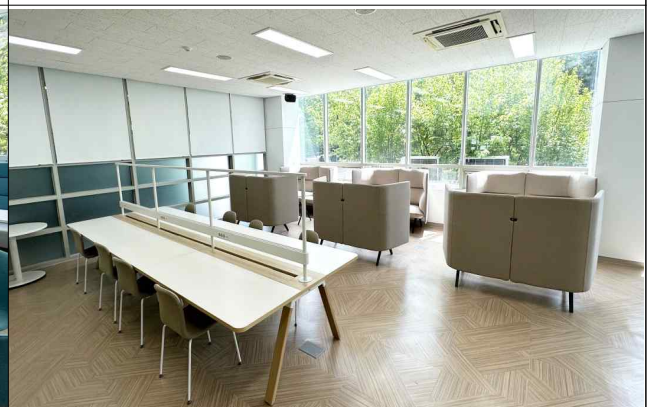
인하드림센터 1관 1층 창업드림라운지