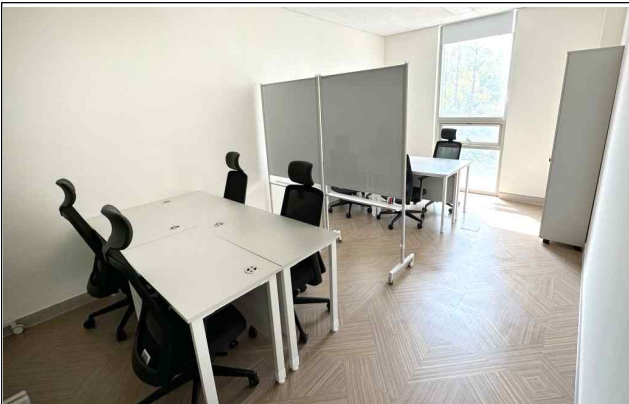
인하드림센터 1관 2층 공용보육실