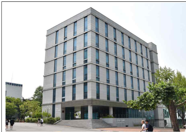
인하드림센터 1관 전경